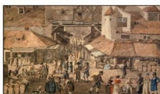
Kotce v 17. století na obraze J. A. Puchmajera