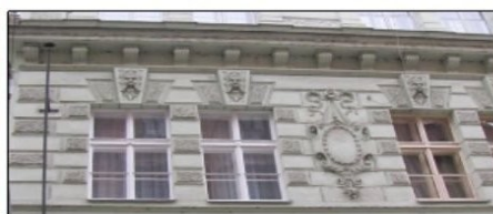
Pohled na první poschodí domu U Ruky V Kotcích

V domě U Ruky se tradovalo povídání o řezbáři z doby Rudolfa II. Když pro svého synáčka zhotovil kolébku, připojil k ní šňůrkou dřevěnou ruku. Za hezkého počasí ta ruka vyčnívala z okna a při houpání kolíbkou mávala všem kolemjdoucím. Může to být pravda, ale možná si tu roztomilost jen někdo vymyslel.